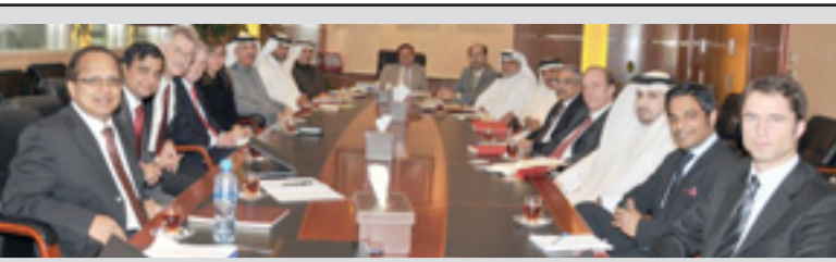
• فخرو مترئسا الاجتماع

www.abladiapress.com e-mail:abladiapress@abladiapress.com