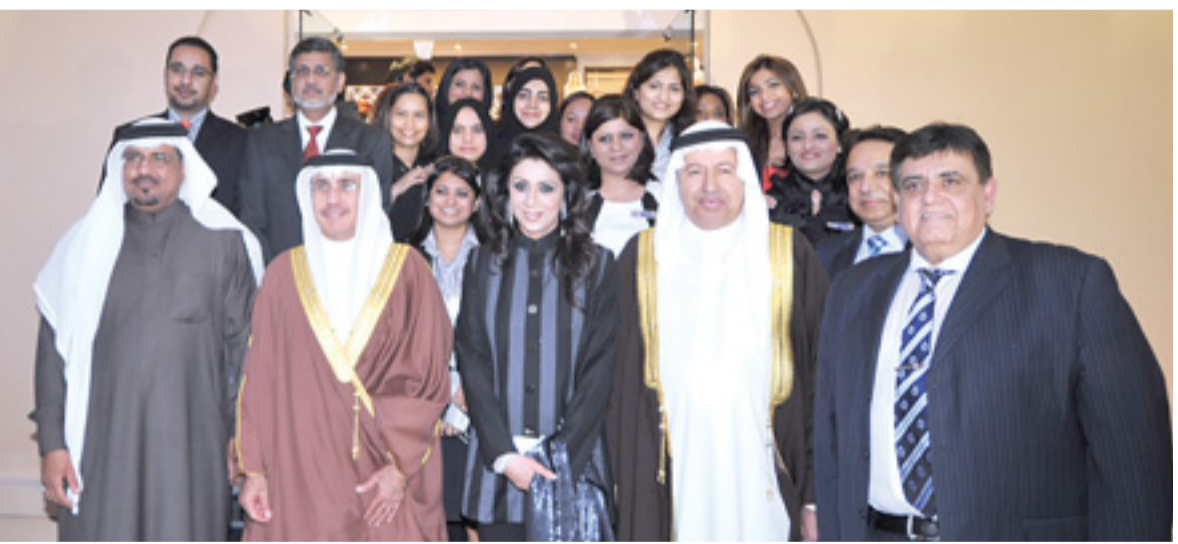
• صورة جماعية لإدارة المركز وعدد من موظفيها

إلى ذلك، قال الشعلة "إن في إل سي سي افتتحت مركزها الاول منذ 3 سنوات منذ 2008، واليوم تفتتح مركزها الثاني، ويصل راس مال المركزين الإجمالي إلى مليون دينار". وفي السياق ذاته كشف الشعلة أنه تتم حالياً دراسة تأسيس مصنع متخصص في إنتاج منتجات التجميل الخاصة بـ "في إل سي سي"، وهو المصنع الأول في دول المنطقة، والثالث على مستوى العالم إذ أن للشركة مصنعين في الهند، مبيناً أنه كان من المقرر أن يتم تأسيس المصنع في الإمارات أو قطر، ولكن نظراً إلى التسهيلات التي قدمت من الجهات المعنية فإنه تقرر