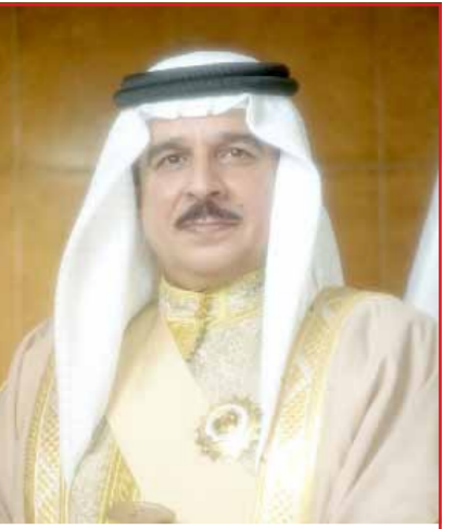
• جلالة الملك

المسؤولين ورجال الأعمال والمواطنين والنخب الفكرية والصحافية والإعلامية الذين أشادوا بما تتيحه الحكومة برئاسة صاحب السمو الملكي رئيس الوزراء من دعم للمواطن ليشق طريقه نحو العطاء والتعبير الذي عزز من سمعة المملكة ومواطنيها إقليمياً ودولياً، وجعل البحريني يحظى بإشادة الجميع وثقة المنظمات؛ ليتبوأ المناصب القيادية فيها. وخلال اللقاء قال صاحب السمو الملكي رئيس الوزراء "إن ما قدمناه وتقديمه لهذا الوطن واجب تحتمه علينا مسؤوليتنا تجاه البحرين وأهلنا المواطنين، ومهما قدمنا فهو قليل أمام ما يستحقه المواطن وطموحه